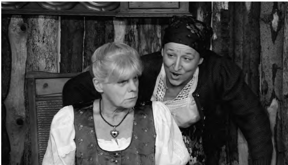
Nebelreißn, Bayerisches Volkstheater Lampenfieber, München

„As Leben gibt dir koan Freispruch! As Leben is des härteste Gericht, was ma si vorstelln ko!“ – Ein bayerisches Theater in fünf Bildern, das die Tradition alter Schauspieldramen wieder aufgreift und mit modernen Theatermitteln verbindet.