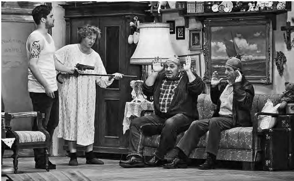
Gangsterfalle, Theaterkastl Neufinsing

Der Mensch: Zu allem fähig und zu allem bereit! Grotesk erzählt – grotesk gespielt – überzeugend anders. Eine Warnung und eine Bereicherung. Genial!