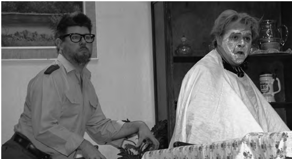
Na dann ... guad Nacht, Theaterbrett St. Nikolaus, München