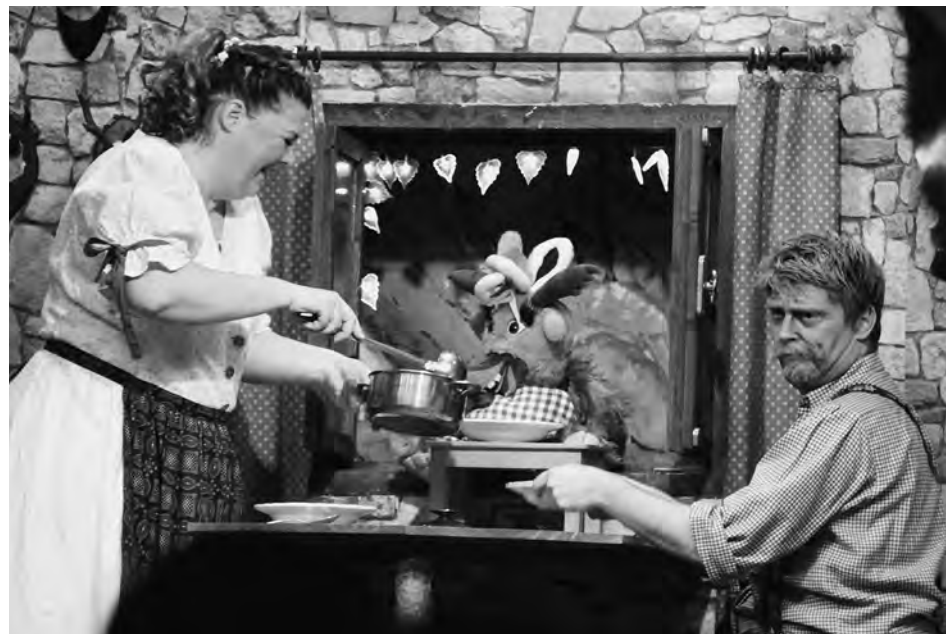
Da Wolpertinger, Theater Pfarrei Maria von Guten Rat, München