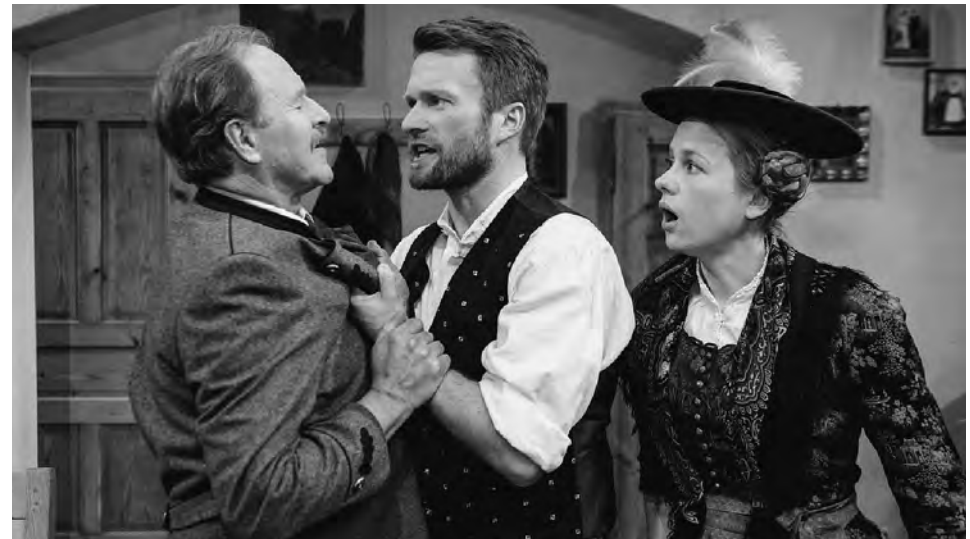
Kartlbauer, Chiemgauer Volkstheater