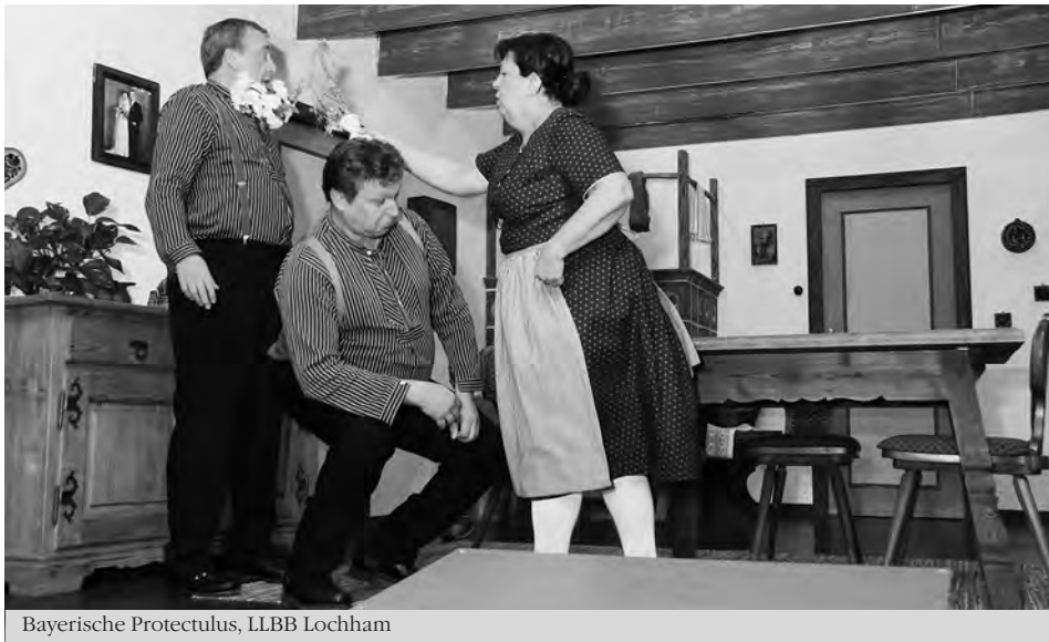
Bayerische Protectulus, LLBB Lochham