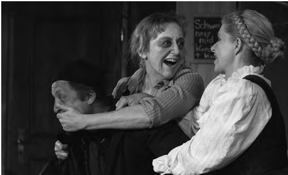
Gspenstermacher, Brumm Brettl München