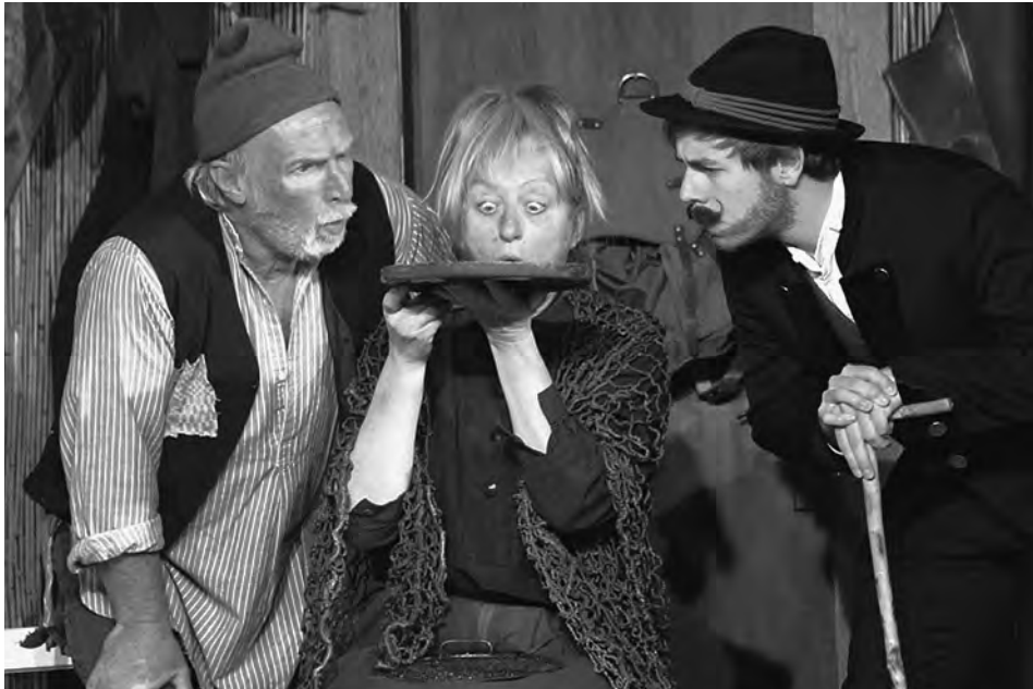
RegnWurmOrakl, Brumm Brettl München, © Fotograf eLJot