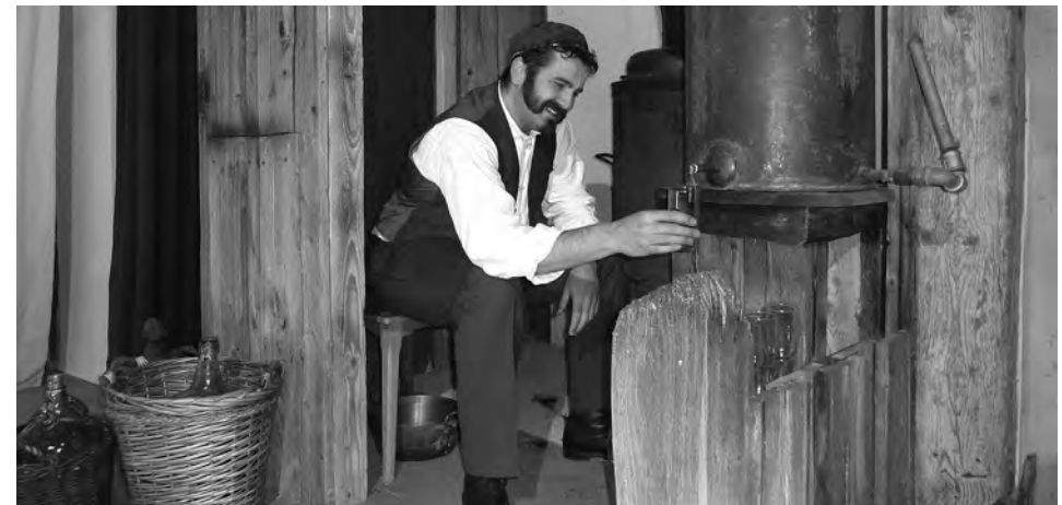
Bayerische Prohibition, Trachtenverein Dettendorf-Kematen

Prohibition in Bayern! Durch kaiserlichen Beschluss wird in Bayern das Schnapsbrennen verboten und das ausgerechnet, wo der alljährliche Brandltag bevorsteht, an dem der neue Schnaps zum ersten Mal ausgeschenkt wird. Der Brandlwirt denkt gar nicht daran, sich dem preußischen Druck zu beugen. Durch allerlei Tricks wird versucht, den eingesetzten Kontrolleur zu täuschen. Weihwasserflaschen und sogar das Taufbecken der Kirche sollen als Verstecke dienen. Geht das gut? Oder ist alles nur ein böser Traum?