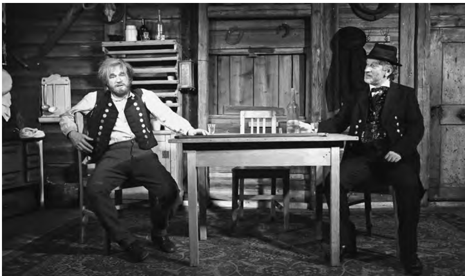
Da Schandstich, Landstorfer Ensemble, München