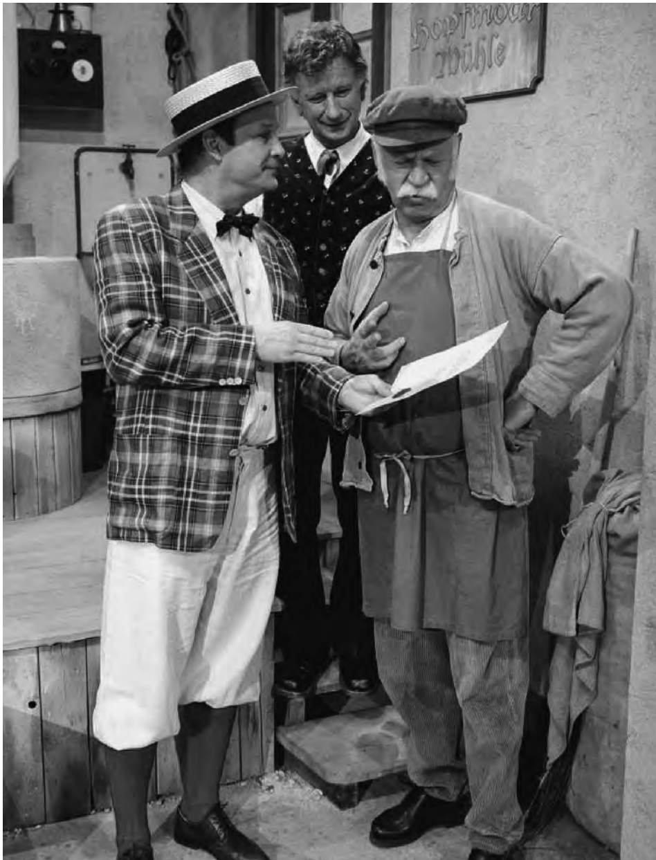
Da Leftutti, Chiemgauer Volkstheater