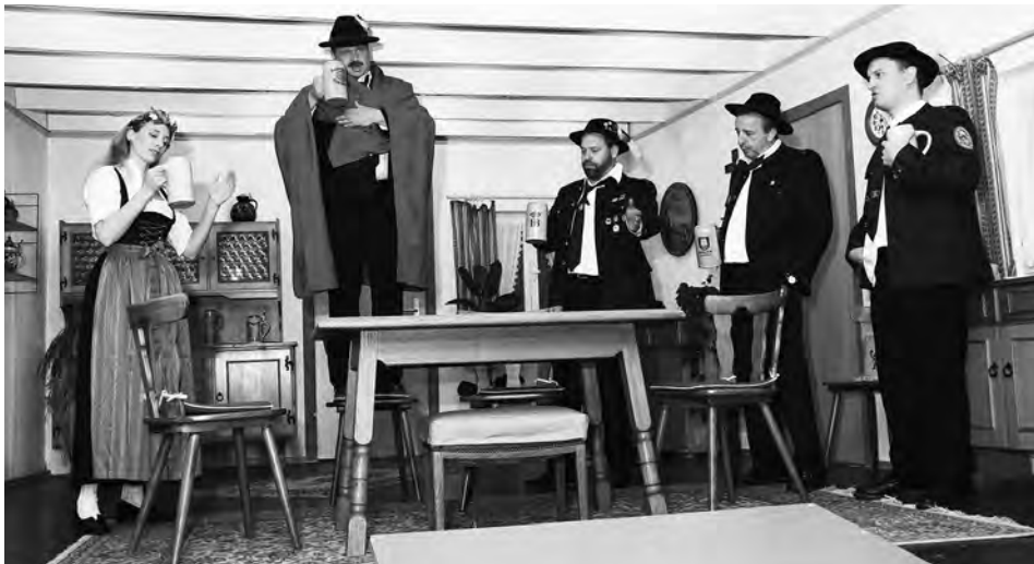
Dreimal hat's gekracht; LLBB Lochham