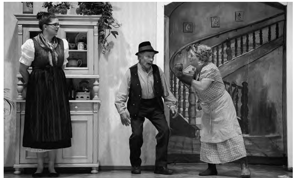
Galaktische Unterschied, Feldmochinger Volkstheater