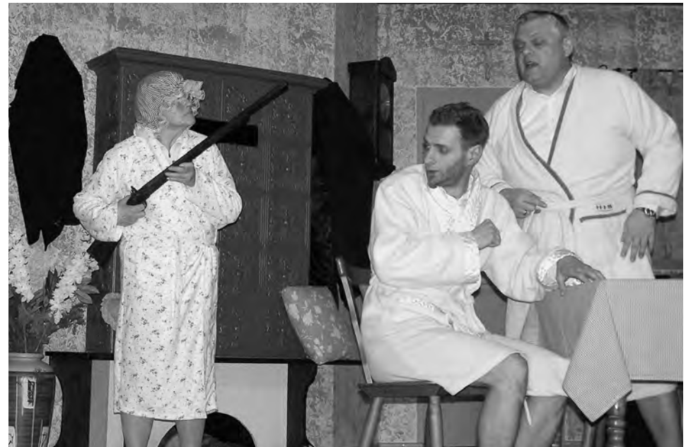
Denken ist Glückssache, Sendlinger Komödienbrett