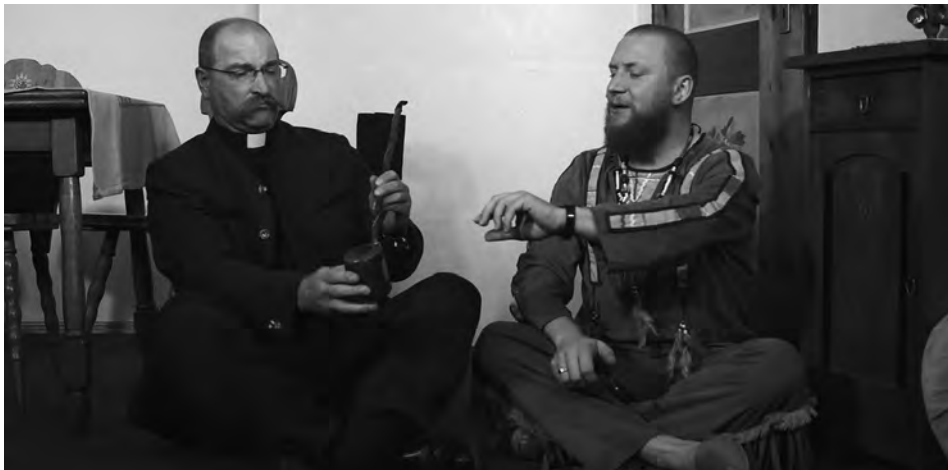
Ramba-Zamba im Hirnkastl, Milbertshofner Bühne

Quasterl und Jackl, zwei verwitwete Bauern haben sich geschworen: Nie wieder heiraten! Die Sache sieht aber schnell anders aus, als der Bürgermeister Brautpaare sucht, die am 10. Mai heiraten und dafür 10.000 Mark kassieren. Die Suche nach den Frauen, die Konkurrenz und viele Verwirrungen müssen erst beseitigt werden bis geheiratet werden kann und die 10.000 Mark ihr Brautpaar finden.