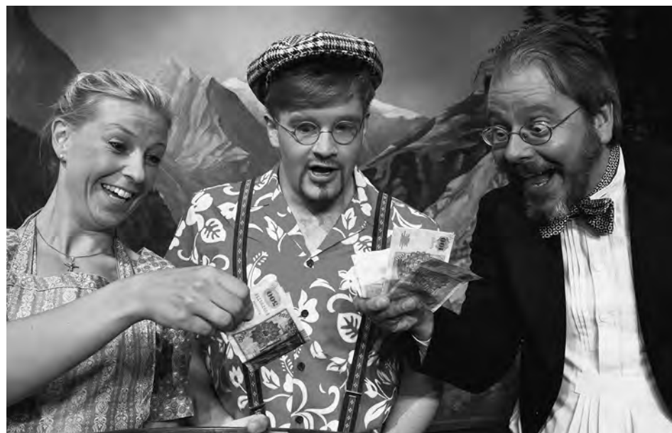
Falsche Katz, Bauerntheater Regensburg