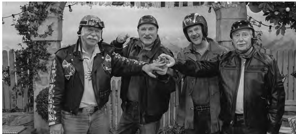
Inselhupfer, Chiemgauer Volkstheater

Südländischer Charme, mafiotische Leckerbissen, gewürzt mit einer Brise „Dolce Vita“ und einer strengen „Mamma Mia“, das alles ergibt die italienischen „Zuaständ“ in einem bis dato normalen Gastbetrieb. Aber was tut man nicht alles, um sich einen der beliebten „silbernen Schöpflöffel“ in der Hotelgastronomie zu verdienen. Da lässt man sich auch mal, mehr oder weniger gezwungen, auf die unkonventionellen Methoden der rassistigen Angestellten ein.