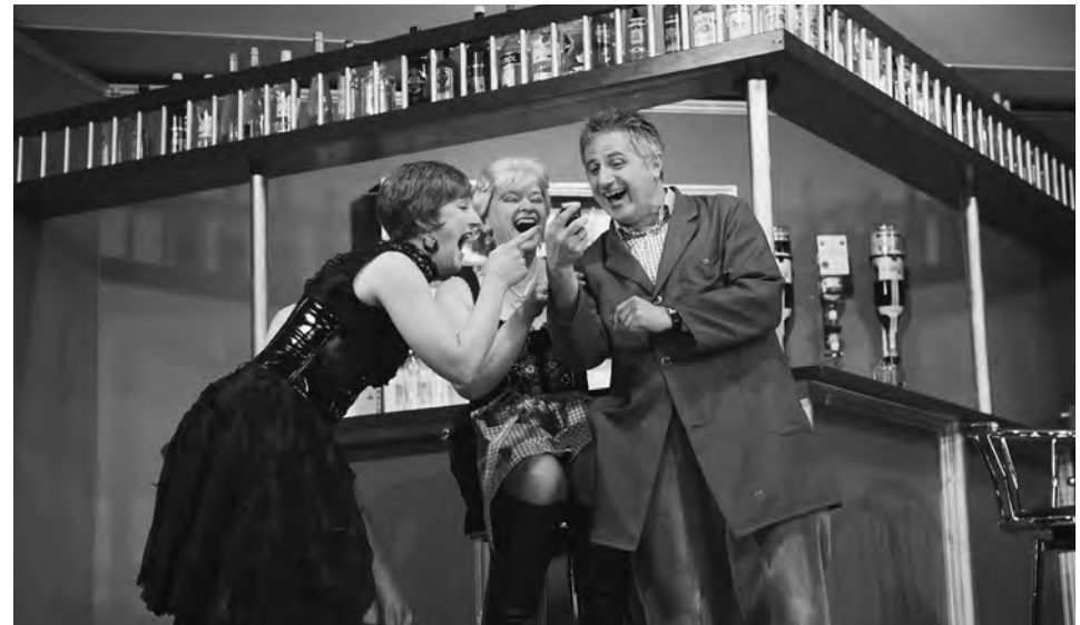
Zoff im Puff, Edelweißverein Bad Feilnbach