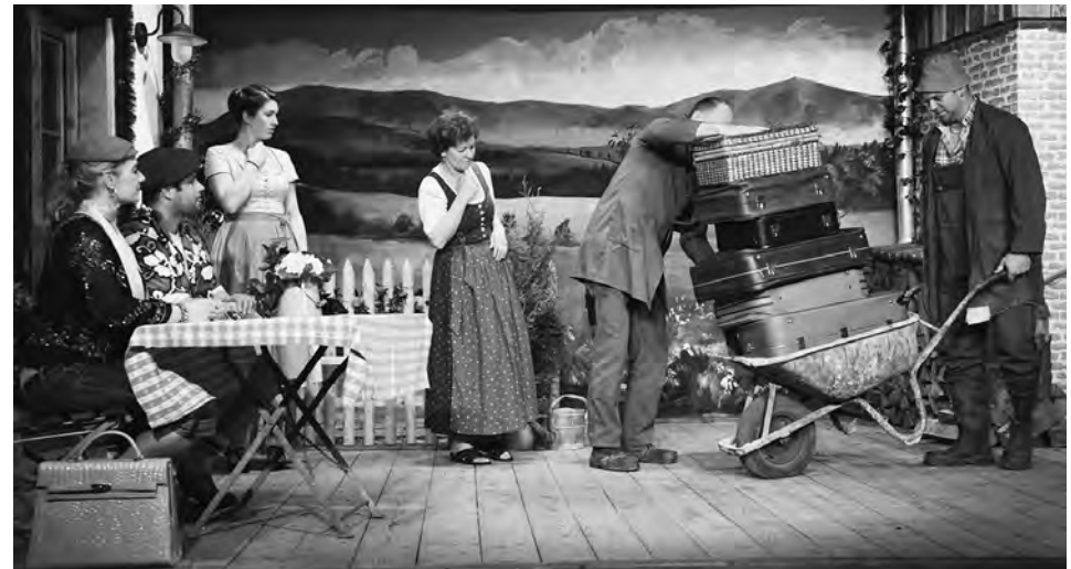
Bezahlte Urlaub, GTEV Immergrün, Pfaffenhofen