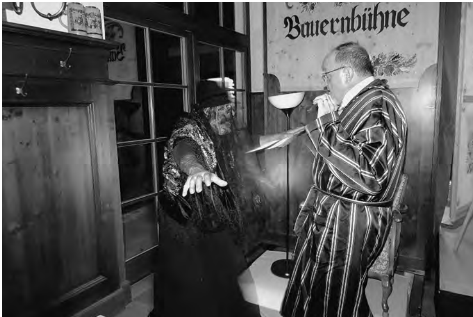
Geisterstund im Waldschlössl, BB Wörthsee