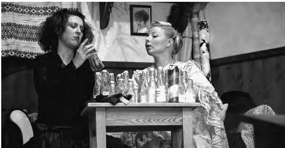
Malefiz Donnerblitz, Theaterverein Buch am Buchrain

Die junge Gutsbesitzerin hätte sich gerne ihren Verwalter geangelt, doch dieser, von der guten Partie zwar nicht ganz abgeneigt, möchte sich gerne, bevor er sich fest bindet, die Hörner abstoßen. Gut, dass er einen Freund hat, der ihn in seiner großen, fast an Dummheit grenzenden Gutmütigkeit aus den verworrensten Situationen wieder heraushilft.