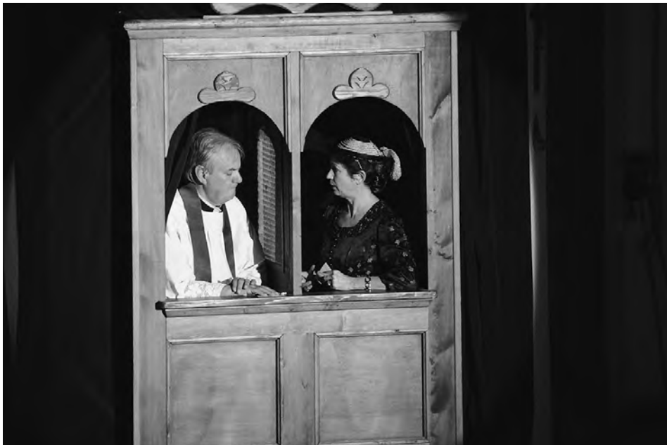
Da Rauberpfaff, Sportverein Putzbrunn