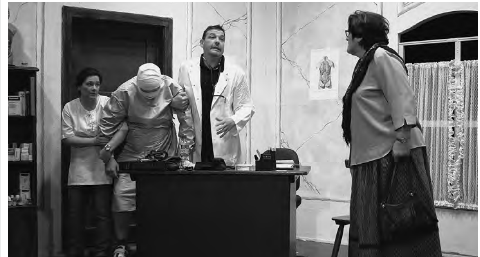
Wenn der Landarzt schläft, Bauernbühne Sendling

Dr. Wohlrath führt eine nette kleine Landarztpraxis und gönnt sich den Luxus einer wesentlich jüngeren, anspruchsvollen Frau. Einen Tag vor ihrem ersten Hochzeitstag überschlagen sich die Ereignisse. Durch ein Missgeschick des Pharmazie-Vertreters sinkt der Arzt in einen, erst mal unerweckbaren, Schlaf. Um dies vor der Ehefrau geheim zu halten, hecken seine treue Arzthelferin und der mitleiderregende Vertreter einen gewagten Plan aus.