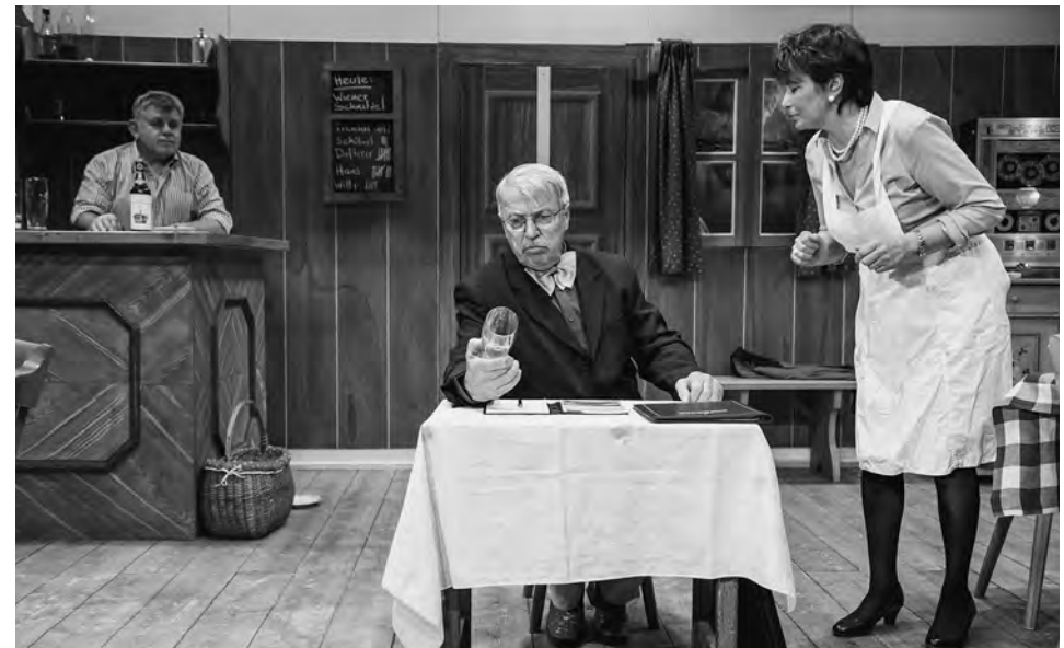
Sag niamois nia, Volkstrachtenverein Farchant

Jahrelanger Zwist herrscht zwischen Obersemmling und Untersemmling. Zwischen den beiden Orten befindet sich zum einen eine Wirtschaft – sogenanntes Niemandland – und zum anderen ein See, der nun zum Weltnaturerbe erklärt werden soll. Die schwierige Frage, ist es nun der Untersemmlinger oder der Obersemmlinger See, beschäftigt die erregten Gemüter der Bürgermeisterin des einen und des Bürgermeisters des anderen Ortes. Ein echt filmreifes Spektakel beginnt!