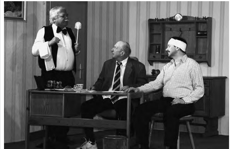
Papa schafft Chaos, Theatergruppe Hagau

Zwei Landstreicher, Paul und Pauline, bekommen in ihrem Nachtlager hinter einem Strauch so einiges über die geplanten Machenschaften des Bauunternehmers Schneider und des örtlichen Bürgermeisters mit. Noch bevor Paul und Pauline verschwinden können, werden sie entdeckt. Da ihr Projekt jetzt durch die unfreiwilligen Mitwisser gefährdet scheint, beschließen Schneider und der Bürgermeister, die beiden für ihre Zwecke einzuspinnen. Doch ob dieser Plan funktioniert...?