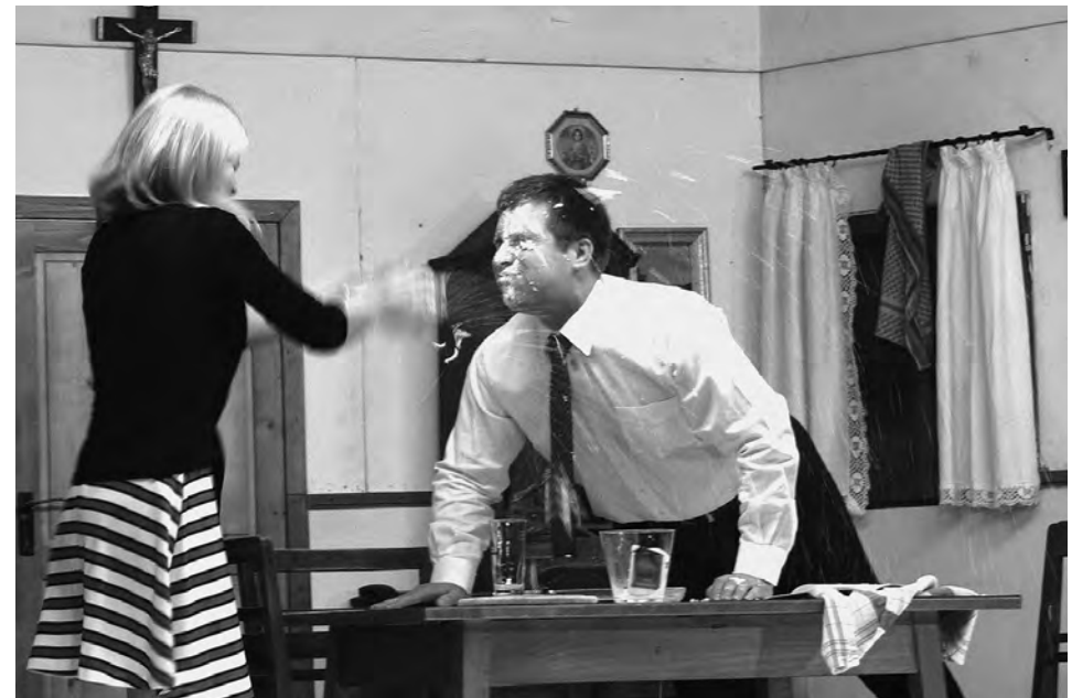
Herr Pfarrer und das Gläschen Most, Trachtenverein Edelweiß, Reichertsheim

Volksstück in drei Akten Dekoration: Bauernstube