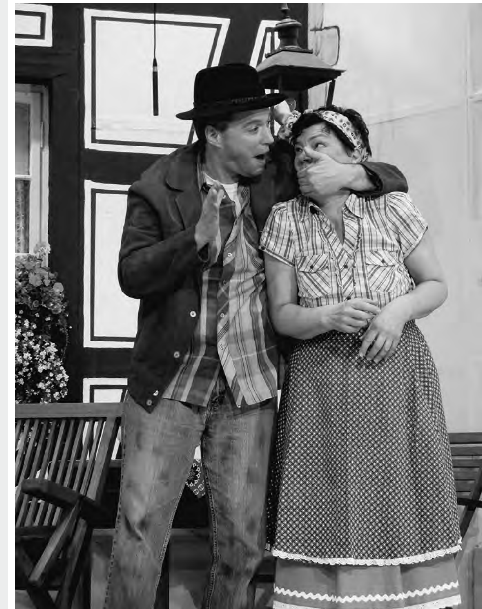
Vergessliche Bürgermeister, Staatstheater Wallhausen