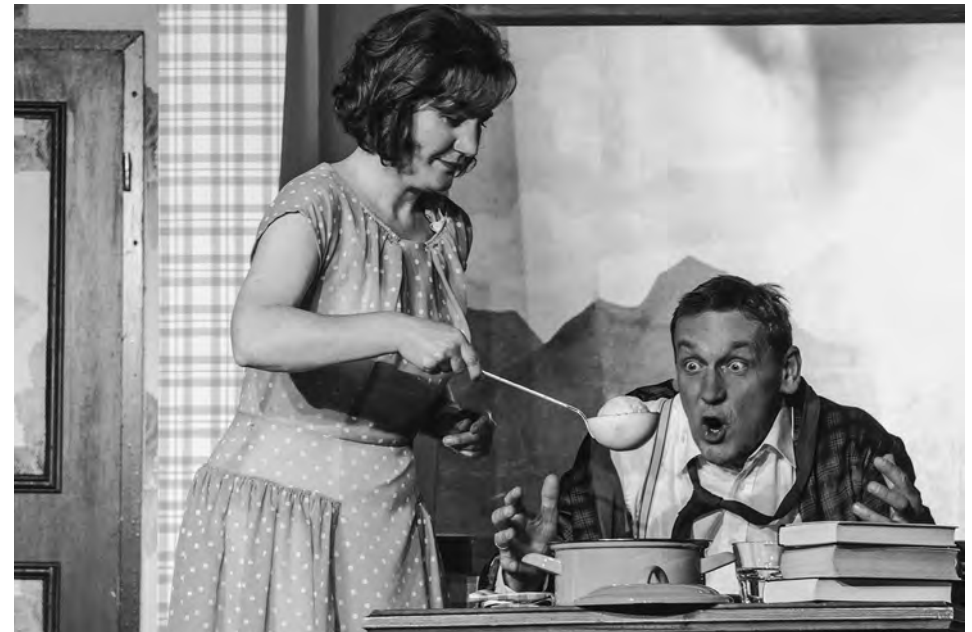
Brezknödl-Deschawü, Brumm Brettl München