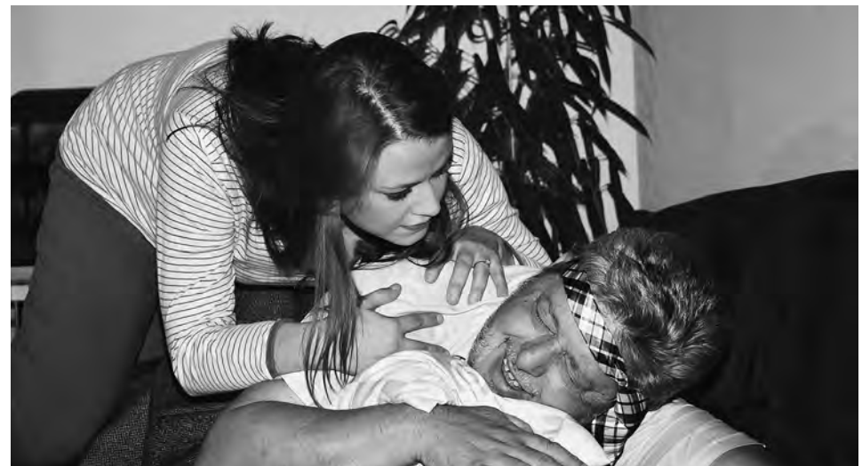
Visionen eines Bürgermeisters, Kolpingsfamilie Höchstädt

Der kleine Ort Schützing hat bei einem Wettbewerb der bayerischen Staatsregierung „Das vorbildliche Dorf“ den ersten Preis gewonnen. Dieser ist mit 15.000 Euro dotiert. Als sich ein hohes Mitglied zur Preisüberreichung ankündigt, wird es sich zeigen, wie weit es mit der „Vorbildlichkeit“ des Dorfes her ist und ob sie es schaffen, eine heile Welt vorzugaukeln, um den ersehnten Geldsegen zu erhalten.