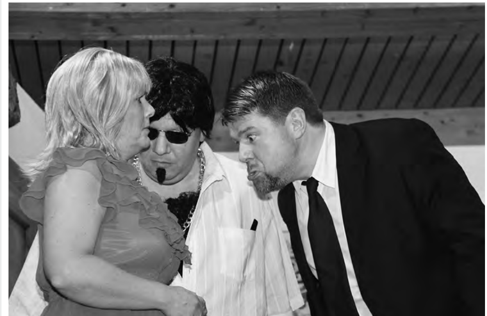
A Rathaus voller Zuaständ, Theaterbrettl St. Nikolaus München

Ein Dorf will seinen „Helden“ – der angeblich den Nordpol durchquerte – gebührend empfangen. Dafür reist extra der Ministerpräsident (MP) an. Immer dabei seine beiden Bodyguards. Der eine sieht überall Verbrecher, der andere hat einen Putzwahn. Als der MP plötzlich verschwindet, drehen die beiden Bodyguards richtig auf. Verbrecherjagd mit italienischer Schmalzlocke, einer Portion Staub, gepaart mit sympathischen Chaoten und jeder Menge Missverständnisse, machen aus diesem Rathaus einen wahren Hexenkessel.