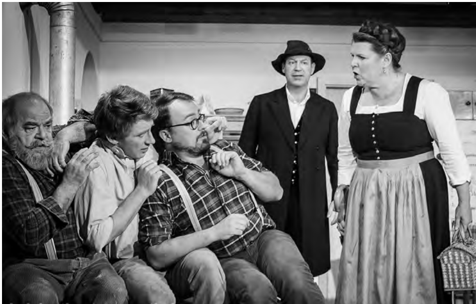
Drei Eisbären, Kolpingsbühne Wörth an der Donau