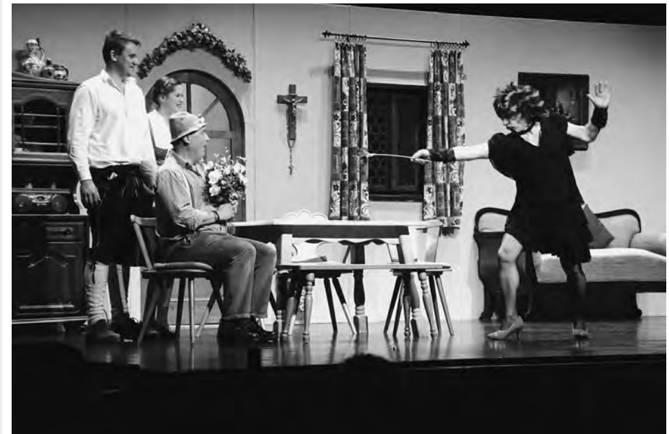
Hl. Korbinian und die falsche Braut, Laienspielgruppe Unterföhring