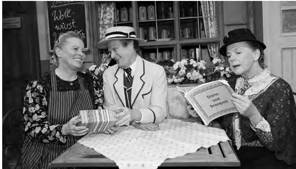
Da Zeitbscheißer, Chiemgauer Volkstheater