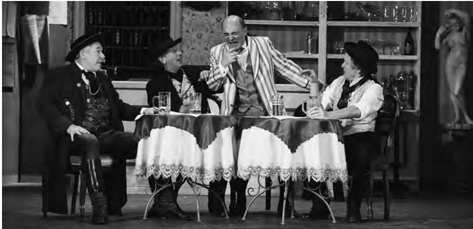
Bixlmadam, Landstorfer Ensemble, München