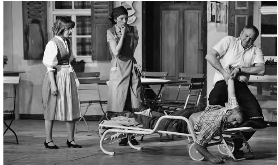
Landkreiscasanova, Kolpingfamilie Thierhaupten