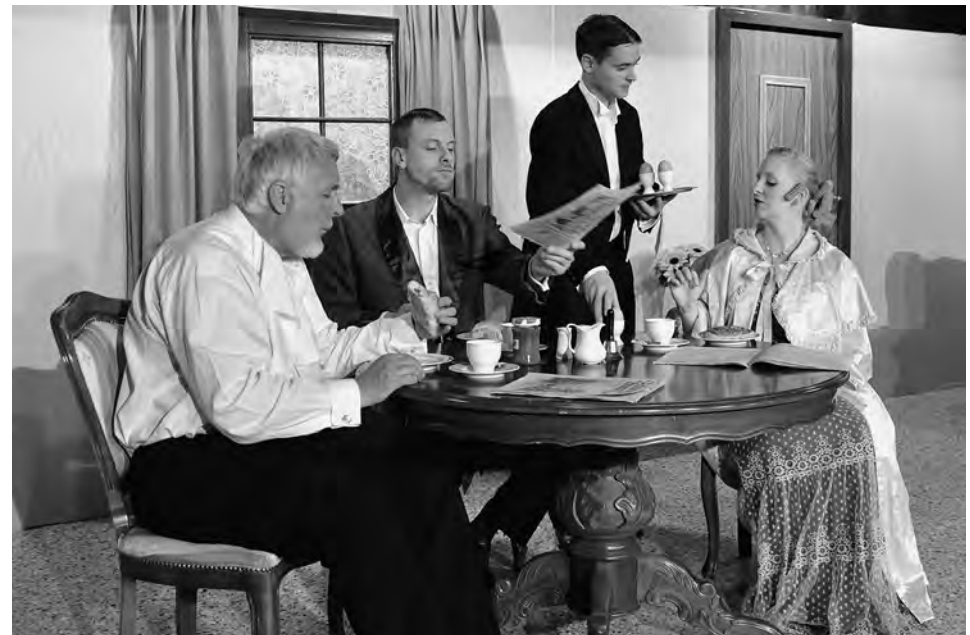
Zu wenig und zuviel, Vaterstetten Brettlbühne