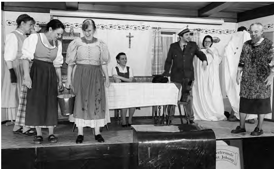
Drei Henna und der nasse Gockl, Theaterfreunde Train