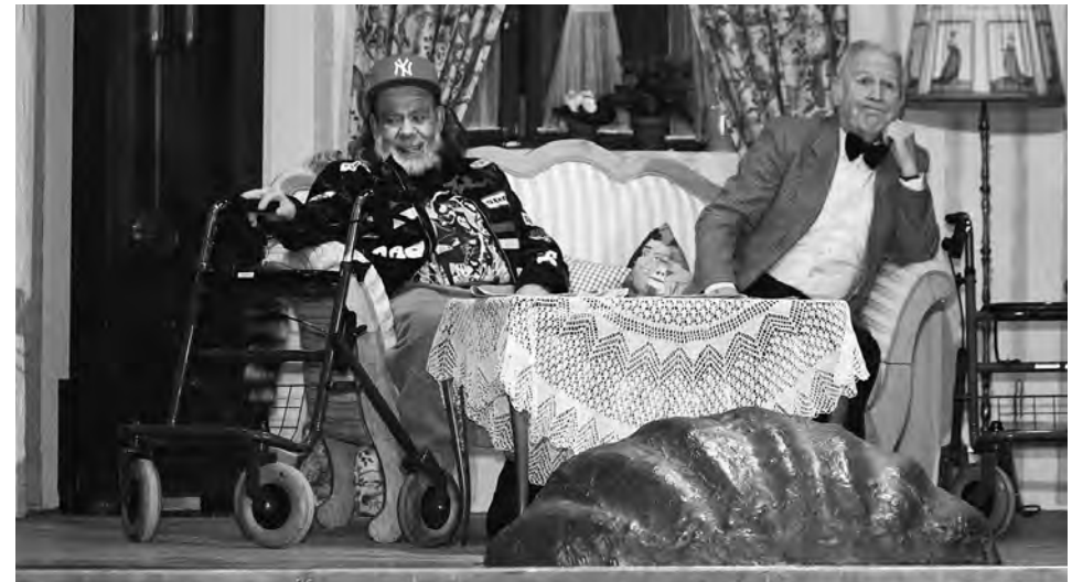
Rollator Gang, Theatergruppe TSV Firnhaberau

Der Traglhofbauer hängt sehr an seinem landwirtschaftlichen Betrieb und setzt alle Hoffnungen auf seine Tochter Lisa, die nach ihrem Landwirtschaftsstudium den Hof in seinem Sinne weiterführen soll. Doch wie es so ist, hat sie ganz andere Pläne. Sie will aus dem Hof ihrer Eltern eine Pferdezucht machen. Der Vater ist entsetzt, doch hat er nicht mit der Raffinesse seiner Tochter gerechnet.