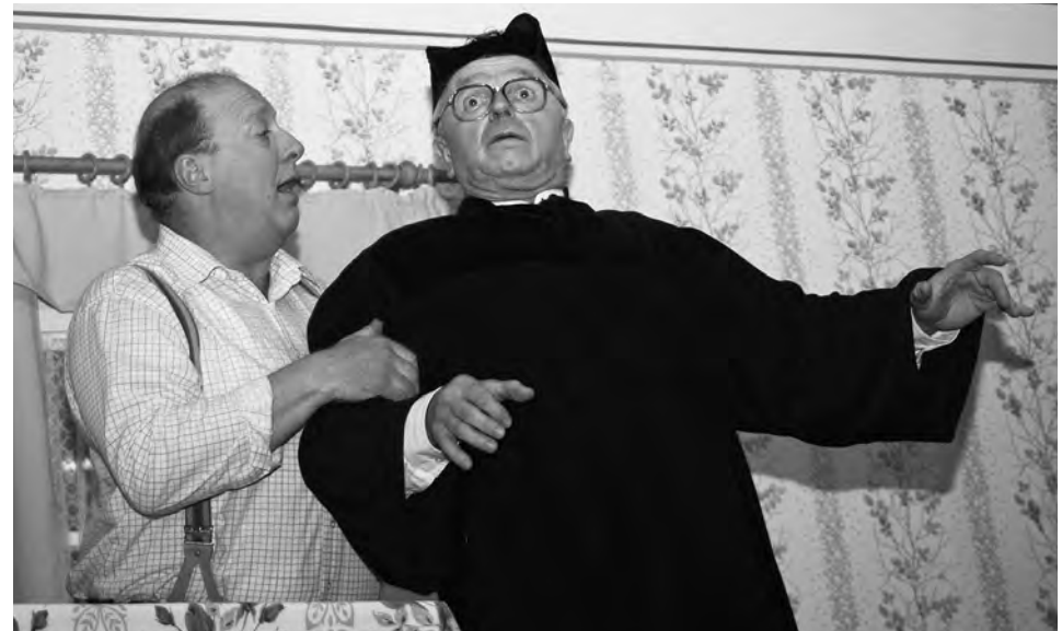
Lästiger Bettg'sell, Theatergruppe Rasch