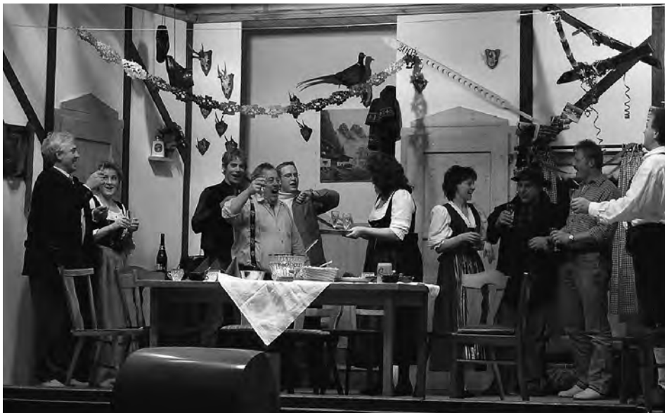
Silvester Hüttenzauber, Hohenwart Theaterbrettl

Was hat dieses ominöse, rotseidene Höserl einer attraktiven jungen Dame in der Rocktasche des Herrn Pfarrer zu suchen? Verständlich, dass das der Anfang von vielen Verwechslungen und Irrtümern ist, bis seine Unschuld bewiesen werden kann.