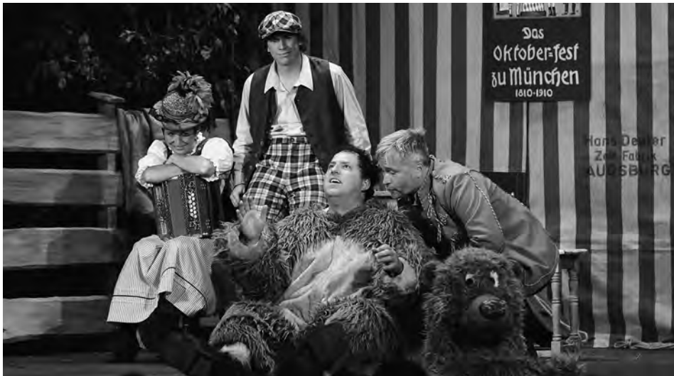
Im Teufelsrad, Bühne Winfried Frey

Der Bruckner Bauer kann seine Schulden nicht bezahlen und wird nun vom geldgierigen Schmied Bauer erpresst. Die beiden Töchter des Bruckner Bauern sollen die Schulden als Mägde abarbeiten und ihm auch sonst gefällig sein. Die listige Oma verhindert, dass die beiden in die Hände des Schmied Bauern fallen und ein glatter Poker zum Schutz der Mädchen beginnt.