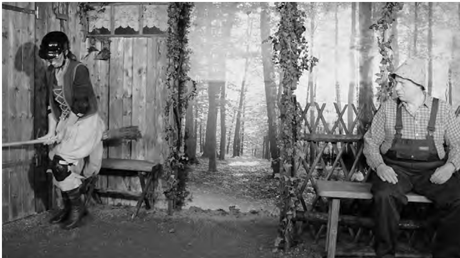
Besenhex, Milbertshofener Bühne