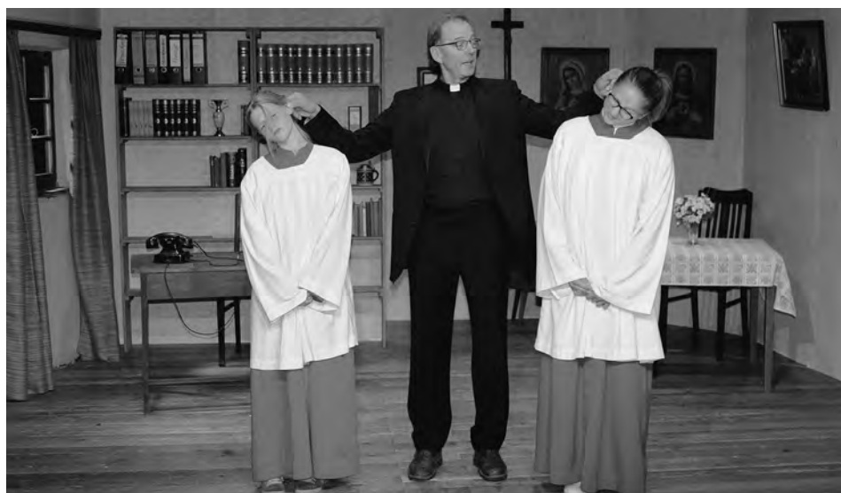
Im Pfarrhaus is der Deife los, Brucker Brettl Fürstenfeldbruck

In diesem Schrank ist im wahrsten Sinn des Wortes wirklich der Teufel los. Es grenzt schon an Hexerei, was in ihm alles passiert. Ein munteres Kommen und Gehen, Verschwinden und wieder Auftauchen. Geht es hier mit rechten Dingen zu?