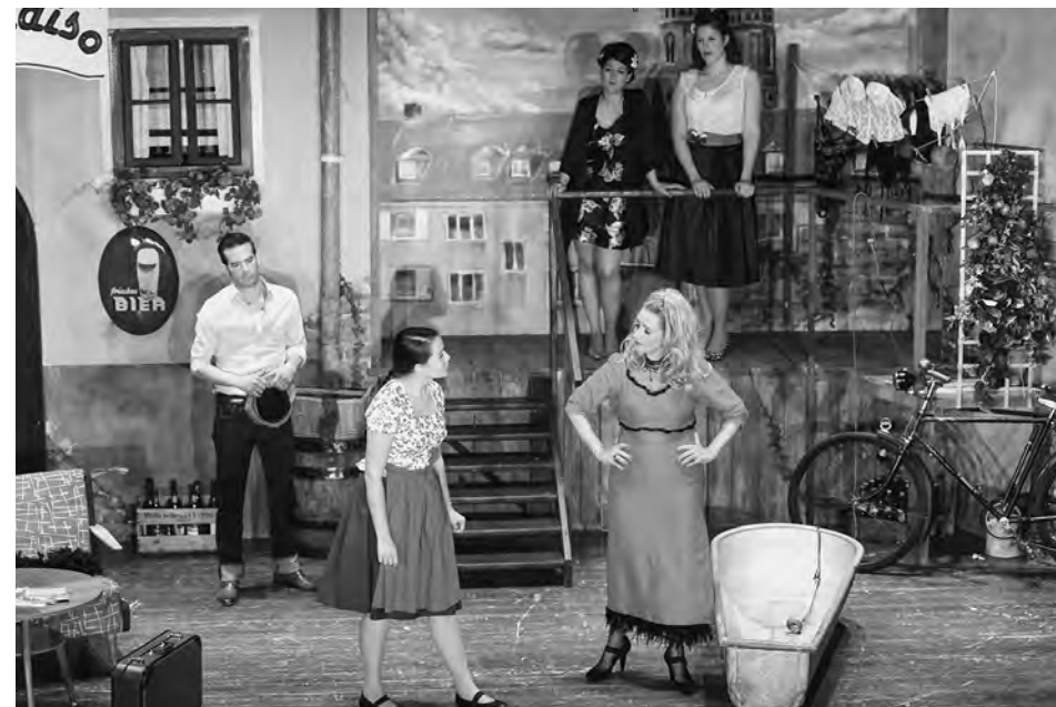
Hummel im Himmel, Bauerntheater Ismaning